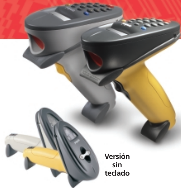
Versión sin teclado

Con los lectores inalámbricos RF de código de barras Phaser P370 y P470 puede elegir el dispositivo que mejor se adapte a las necesidades de su aplicación, en cualquier ambiente. El lector P370 es ideal en ambientes difíciles como serían aplicaciones de almacenes y plataformas o patios de carga. El lector P470 le ofrece las mismas funciones de captura de datos para usos en interiores, por ejemplo, las tareas de inventario y las